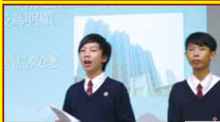
熱島效應專題分享