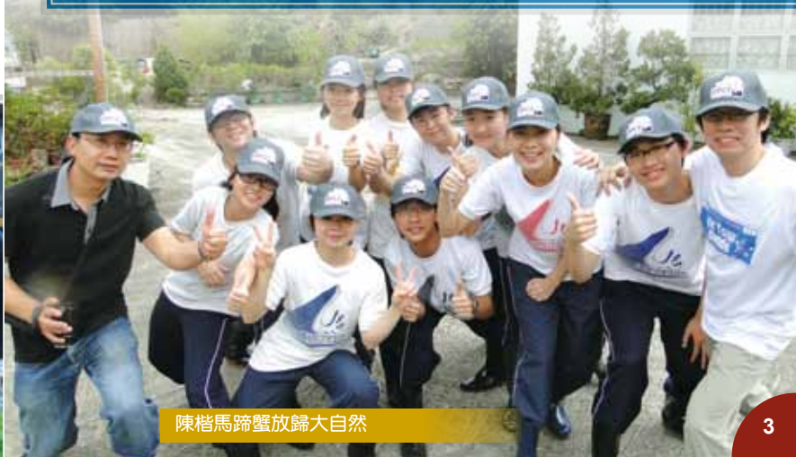
陳楷馬蹄蟹放歸大自然