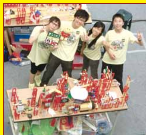
綠色能源應用創作機關王競賽台灣總決賽冠軍

● 參與香港青年協會舉辦的「香港綠色能源應用創作機關王競賽」及「創意科藝工程計劃」