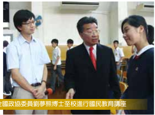
全國政協委員劉夢熊博士至校進行國民教育講座