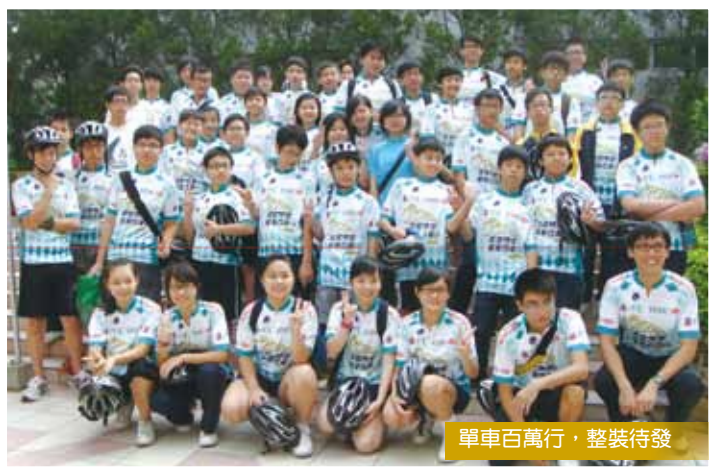
單車百萬行，整裝待發