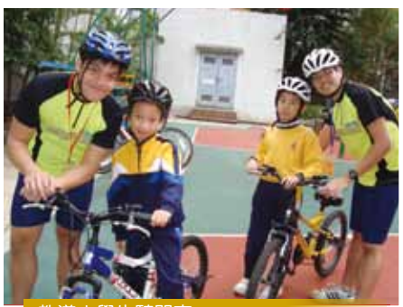
教導小學生騎單車

服務社會是培養同學品德的重要渠道，所以本校鼓勵同學多關心社會，服務有需要人士。除了透過不同的校內組織，如社會服務組、家長教師會與學生會等，參與不同的義工服務外，本校更推行「『環保·科學·創意』中小學協作計劃」及「長者學苑」，希望同學能跳出校園，關顧他人，服務社區，回饋社會。