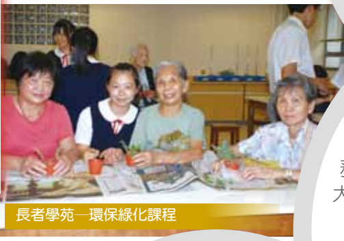
長者學苑—環保綠化課程