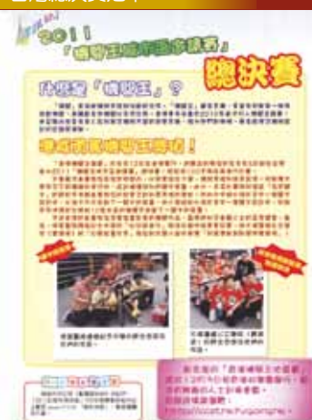
傳媒專訪 - 綠色能源應用創作機關王競賽台灣總決賽冠軍