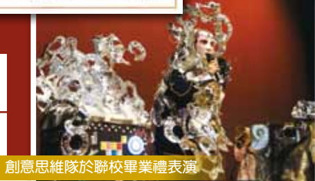
創意思維隊於聯校畢業禮表演

過去一年，本校師生積極參加教育局及國民教育中心舉辦的中國內地交流團，分別造訪中山及柳州。旅程中，同學無不對內地城市的規劃及競爭力感到驚訝，亦認識到教育是助人脫貧的最有效途徑。今年，學校亦會安排不同的境外學習交流團，讓學生有更多機會走出香港親身去認識，去體驗，以擴闊眼界。