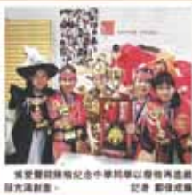
卓越學生獲獎報道

【香港專訊】記者鄭曉楓報導：香港青年總會今年 3 月及 4 月分別舉辦多間中、小學、專科及非牟利團體聯誼賽，其中有一間中學、1 間小學，分別奪得創意組的冠軍、季軍及季軍。此外，在比賽的青少年評審員大獎。 利用廢物循環再造戲服 今年 5 月在香港龍馬嘉蘭利定大學舉行的「2011 創意組國際設計賽」，香港專科團體紀念中學在該組的「創意組」獲季軍，在 44 間國際組別的學校中，勇奪季軍。4 名在