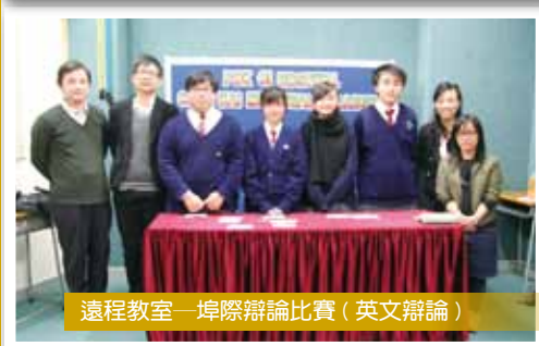
遠程教室—埠際辯論比賽（英文辯論）