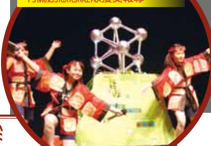
2011 美國創意思維世界賽