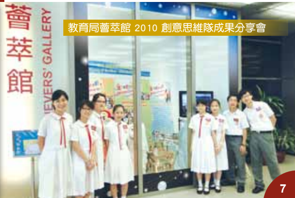
教育局薈萃館 2010 創意思維隊成果分享會