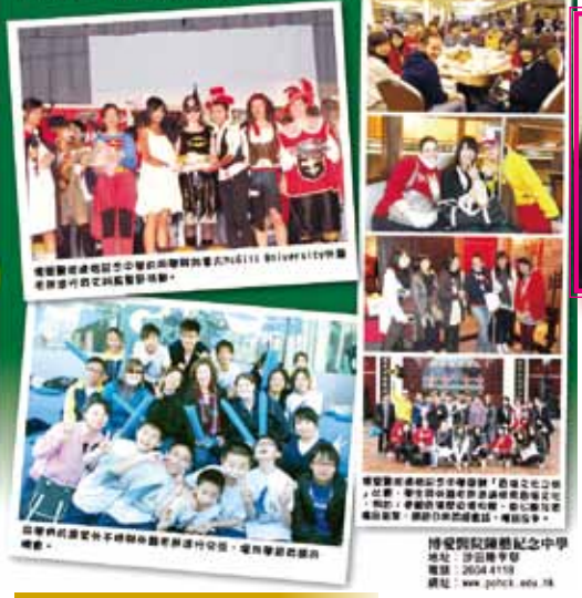
news from Oriental Daily

博愛醫院屬下的學校致力推廣英語教學，屬下的陳國威小學及陳震紀念中學自2008年開始，邀請加拿大McGill University之英語外籍老師及英語教學專家蒞臨本校進行英語教學實習，提升學生英語水平。 博愛醫院陳震紀念中學邀請加拿大McGill University之英語外籍老師蒞校實習，所獲老師均為該校專職老師，並與該校英語科進行交流，提升教學質素，而該校學生亦能享受與該校專職老師之英語教學，掌握「國際英語」之語言。此外，升格後更參與該校之口語訓練計劃，協助進行英語溝通及提高英語聽力等。 為了加強與海外對粵文在了解及讓學生有更多時間學習「課堂」的英語，博愛紀念中學特舉辦了「Hong Kong Culture Trip/香港文化之旅」，以真實的試讀學生面對不同語言環境之文化行程，讓學生與老師共同參與及體驗香港文化之第一手，學生與老師共同參與及體驗香港文化之旅，亦為加強學習英語的絕佳機會。