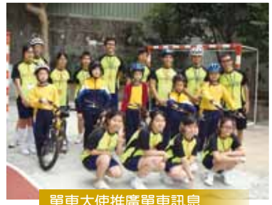
單車大使推廣單車訊息