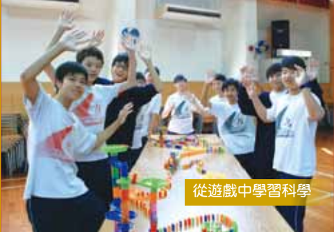
從遊戲中學習科學