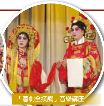
「粵劇全接觸」音樂講座

學校鼓勵同學參與校外組織活動和比賽，如聯校學生會、明報校園記者訓練等。本校學生連續三屆曾獲得「沙田區傑出學生獎」。此外，本校高中學生於去年參加「第一屆沙田學生大使」，自行策劃社區服務，並獲得「最佳表現」殊榮。