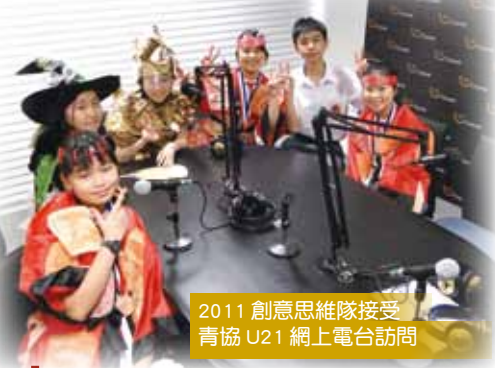
2011 創意思維隊接受青協 U21 網上電台訪問