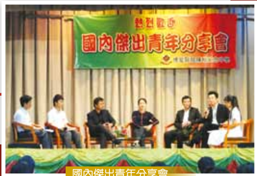
國內傑出青年分享會

學校鼓勵同學參與校外組織活動和比賽，如聯校學生會、明報校園記者訓練等。本校學生連續三屆曾獲得「沙田區傑出學生獎」。此外，本校高中學生於去年參加「第一屆沙田學生大使」，自行策劃社區服務，並獲得「最佳表現」殊榮。