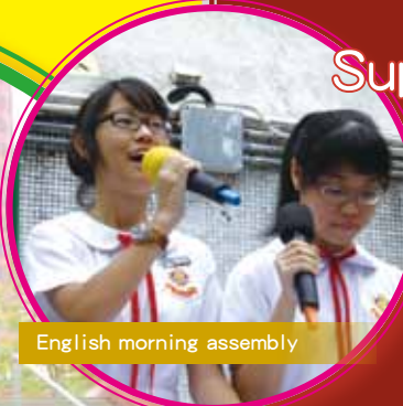
English morning assembly