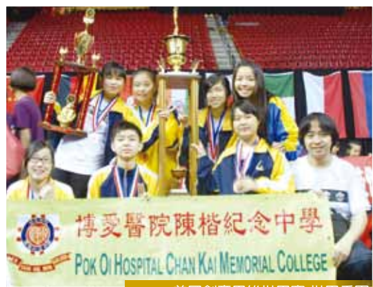
2011 美國創意思維世界賽 世界季軍

本校活動多元化，每年進行不同的學術活動、全校性大型活動，而亦設有不同的學會、校隊讓同學參與，以發展同學的興趣。此外，學校亦會不斷引入不同的活動形式及元素，讓同學能從活動中發展潛能。在校外比賽方面，學校亦鼓勵同學參與，以增廣見識，建立自信。近年於創意活動方面，同學表現更見突出。