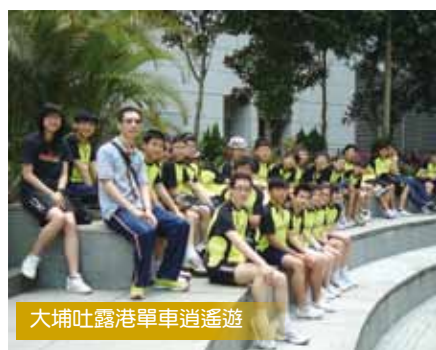
大埔吐露港單車逍遙遊