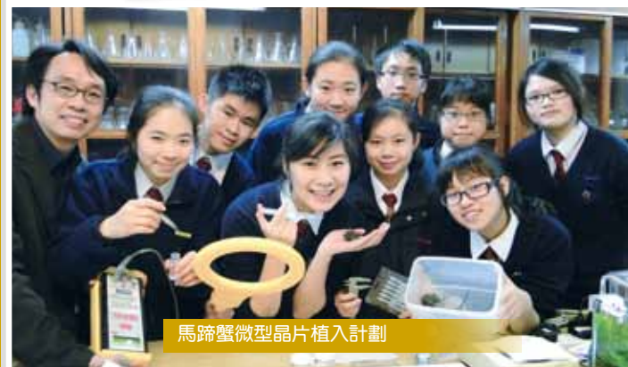
馬蹄蟹微型晶片植入計劃