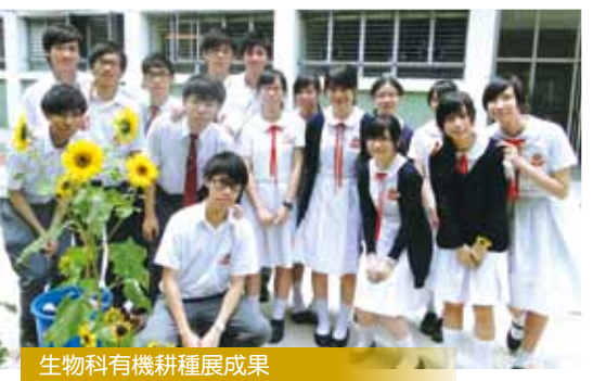
生物科有機耕種展成果

在初中階段整合通識課的內容，輔以班主任課、成長課、關愛課程等推行德育及國民教育。此外，舉行系統性的生命教育講座、了解國家情況的名人講座、工作坊及日營等，讓學生懂得社會公德，遵守公民基本道德規範，誠實守信，敬業樂業；心中有祖國、心中有集體、心中有他人；確立國民身份，對國家多點關心與認識。