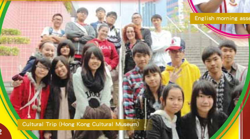
Cultural Trip (Hong Kong Cultural Museum)