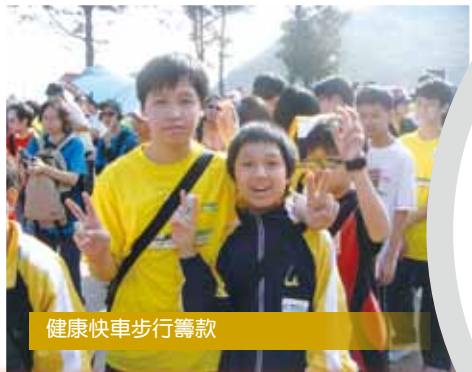
健康快車步行籌款