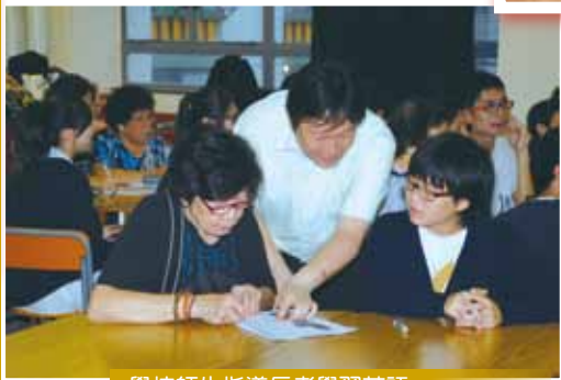
學校師生指導長者學習英語

學校與國際四方福音會隆亨耆年中心合作設立「長者學苑」，由本校師生及校友組織活動及學習班（如：環保綠化課程、英文班、電腦班及健康班等）予大圍區內長者參與。