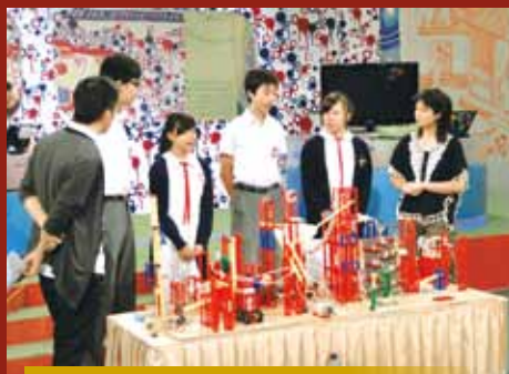
機關王冠軍隊接受香港電台訪問

今年本校參與香港青年協會舉辦的「香港綠色能源應用創作機關王競賽」，四位初中三學生獲得香港區冠軍，並於七月代表香港前往台灣參與「綠色能源應用創作機關王競賽——城市盃邀請賽」，擊敗五十一隊來自世界各地參賽隊伍，勇奪國中組冠軍，為本校及香港爭光。