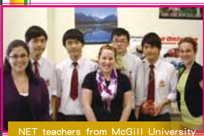
NET teachers from McGill University and our students