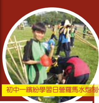
初中一繽紛學習日營羅馬水炮制作