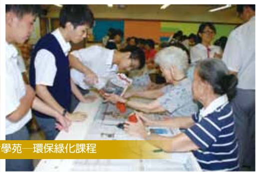
長者學苑—環保綠化課程