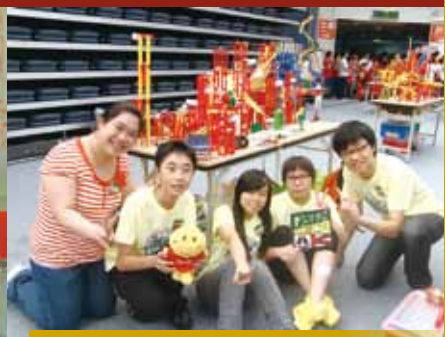
綠色能源應用創作機關王競賽台灣總決賽冠軍