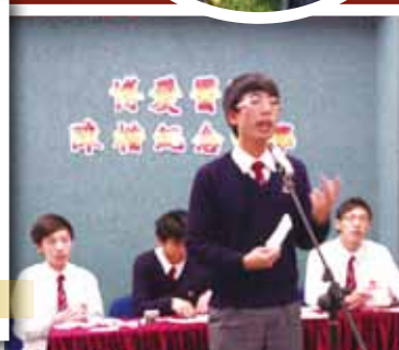
遠程教室 -- 埠際辯論比賽（中文辯論）