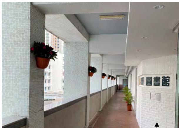
o. 樓層走廊掛牆盆栽(3 樓) p. 「陳國威圖書館」外座地盆栽