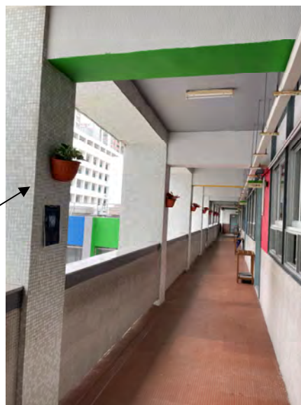
o. 樓層走廊掛牆盆栽(1-6 樓)