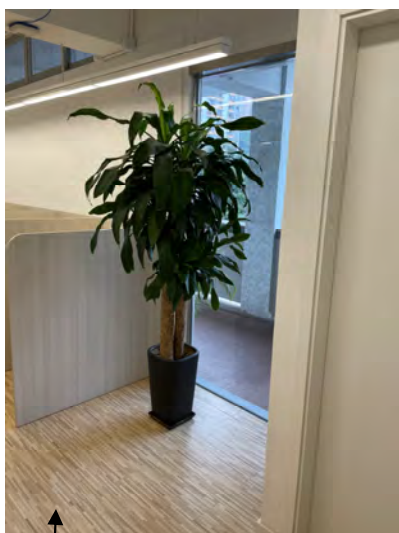
p. 學生自修室內座地盆栽