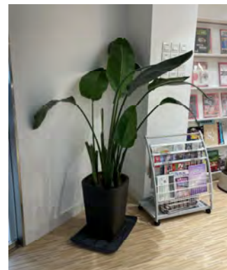
p. 「陳國威圖書館」內座地盆栽