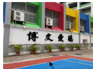
h. 籃球場四周擺放之座地盆栽